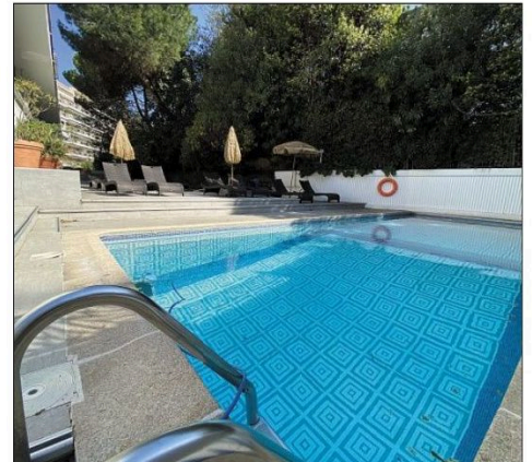
L'espace de détente insoupçonné derrière l'hôtel.